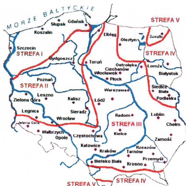
Rys. 1 Strefy klimatyczne Polski i temperatury obliczeniowe

Położenie obiektu, w którym planowany jest montaż, na mapie ma wpływ na pracę instalacji oraz na dobór mocy projektowanego kotła. W zależności od współrzędnych geograficznych rozbieżności w temperaturach projektowych mogą mieć znaczącą wartość i wpływ na zapotrzebowane na ciepło w budynku. W skali kraju ilustruje to poniższa mapa (Rys.1).